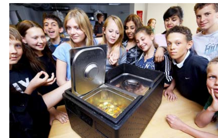
Kalvefrikassé og chokoladecake. Nogle af 6. klasserne har lavet mad til Projekt Udenfors madbil, der deler mad ud til hjemløse.